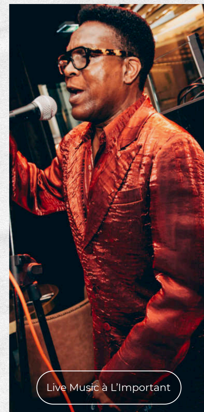
Live Music à L'Important

Ce voyage gustatif se déroule dans une ambiance festive et musicale. Grandes tablées et mobilier d'exception, profitez d'un service de restauration tardif avant de prendre le chemin de L'Important - Night Club.